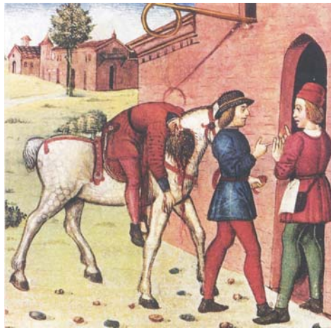
"Il buon samaritano"

Min. di C. De Predis, sec XV (Torino, ex Biblioteca Reale)